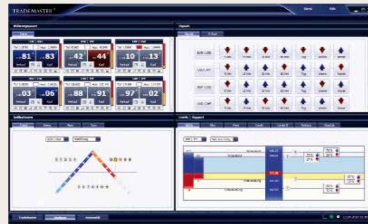
Neueste Analysemethoden und –werkzeuge für zielorientierten, erfolgreichen Börsenhandel.

Diese Clientsolution wurde mit zukunftsweisenden Technologien entwickelt. Hierzu gehören neben der Programmierung nach höchsten derzeitigen Maßstäben auch Systemredundanzen zur Ergebnissicherung, eine redundante Serversolution sowie selbstverständlich eine speziell verschlüsselte Datenübertragung. So ist eine maximale Transaktionssicherheit gewährleistet. Die integrierte Zweibege-Ordertechnologie basiert auf unterschiedlichen Api-Connections und enthält eine zusätzliche Unterstützung durch das bankenübliche FIX-Protokoll. Damit wäre es dem Händler rein theoretisch möglich, über den adblue TradeMaster® 170.000 Trades auszuführen – pro Sekunde!