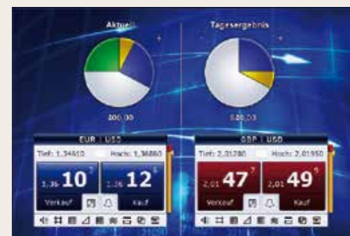
Schnelles, zielorientiertes Trading.

MIT DEM ADBLUE TRADEMASTER® IST DER BÖRSENHANDEL REVOLUTIONIERT UND NEU DEFINIERT.