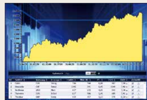
Vollautomatisierter Börsenhandel rund um die Uhr.